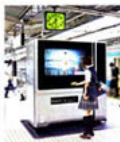
お客様の上部にセンサーを設置する「次世代自動車」。画像認識技術によって購入者の性別や年齢を感知し、それに合わせた商品をお薦めする。JFE東日本が導入している