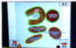
レジ機に置かれたディスプレイで、認識結果が一瞬で表示される。同じ形状だがトッピングの具材が異なる「アチャゴ(ゴッツウ)」と「アチャ(果実)」の違いも正確に認識できる